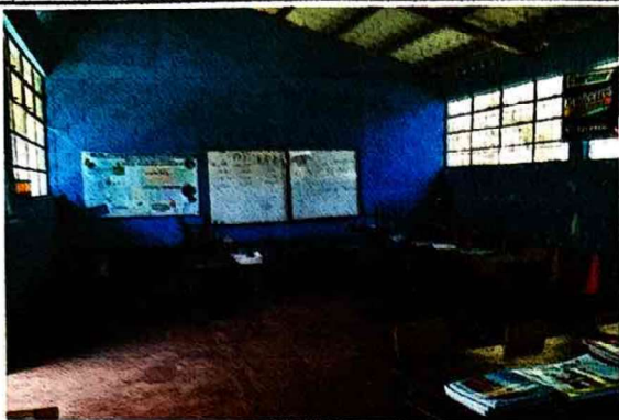
Foto1: Sustitución de piso por Azulejo Interior por deterioro.