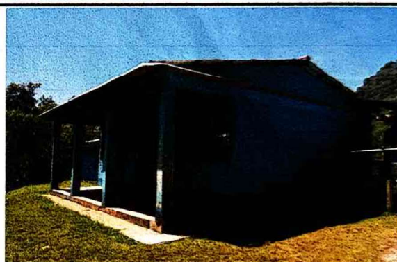
Foto 2: Sustitución de Canal alrededor de la Escuela y bajada de agua por deterioro.