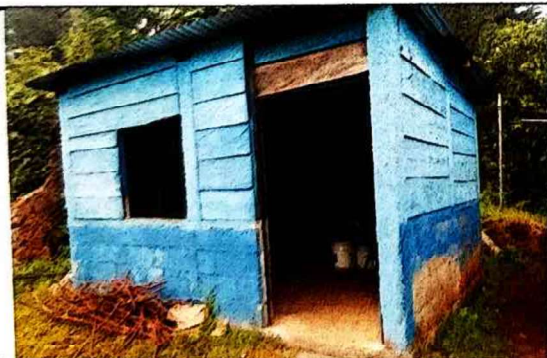
Foto 1: Sustitución de Pared, repello, techo y ampliación de escuela por deterioro.