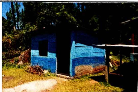
Foto 2: Sustitución de Pared, repello, techo y ampliación de escuela por deterioro.